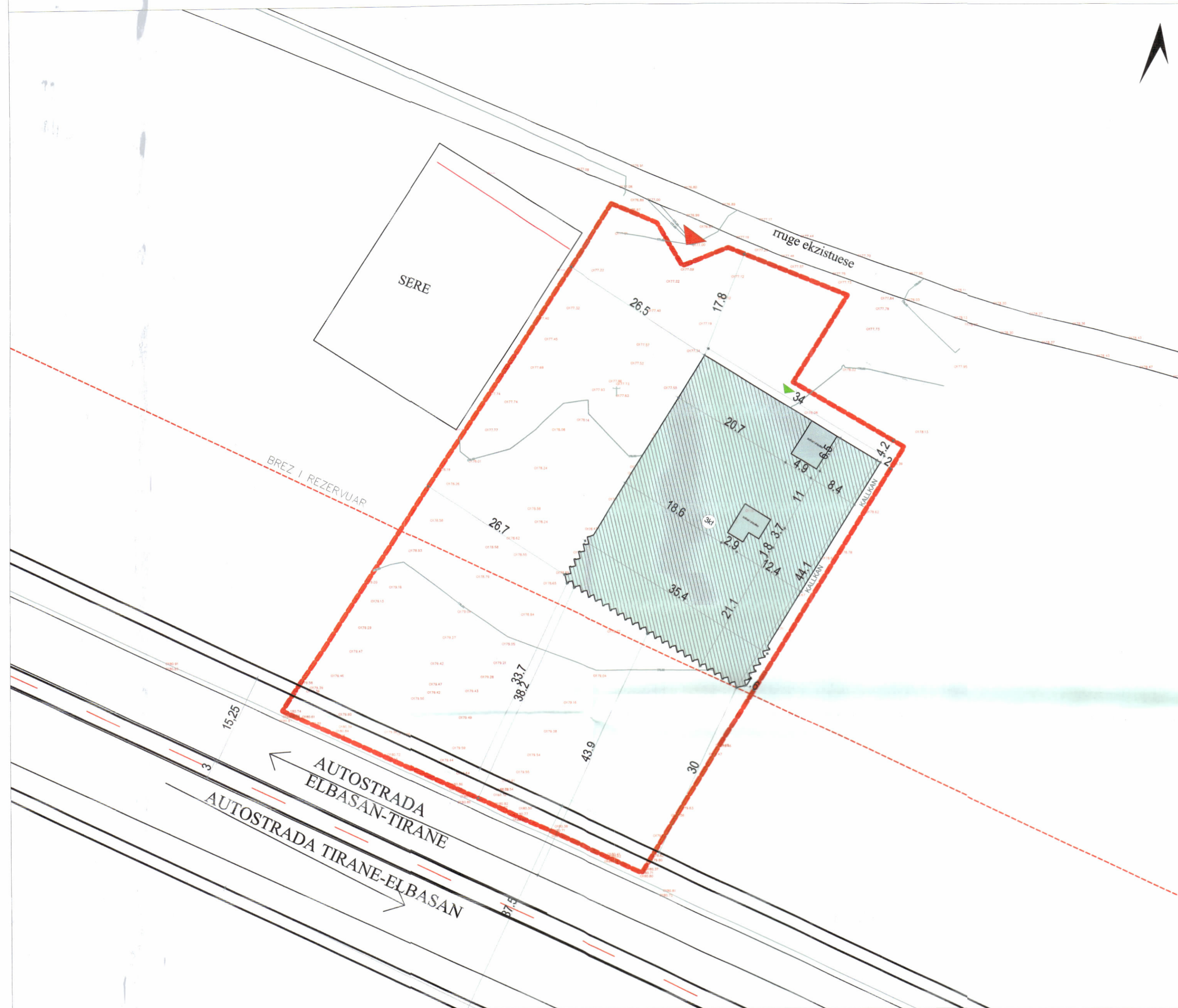
PLANI I VENDOSJES SË STRUKTURËS SHK. 1:500